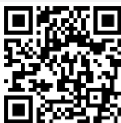
E-book manual for e-Request