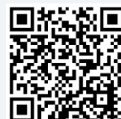
Video manual for InvenTech Connect